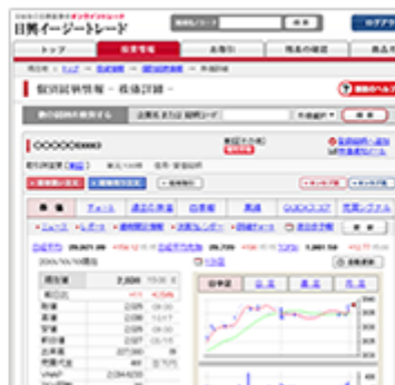
個別銘柄情報画面